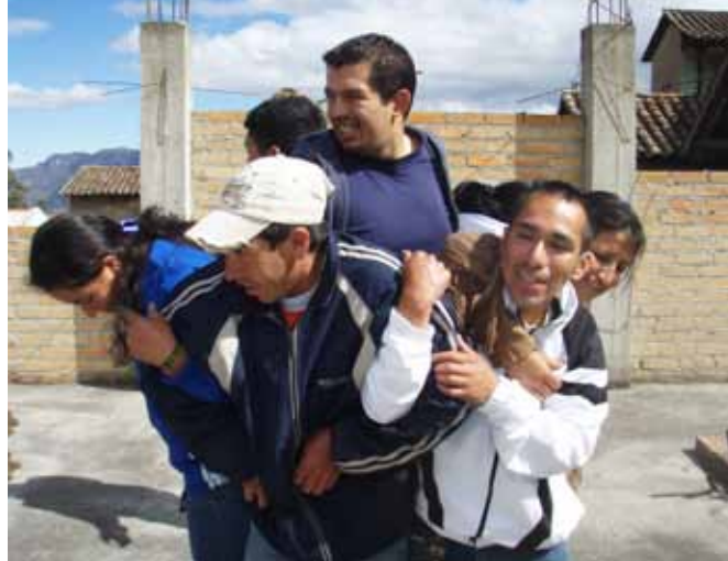
Amigos sin Fronteras organizan varias actividades. Derecho: Consejo juvenil de Oña.