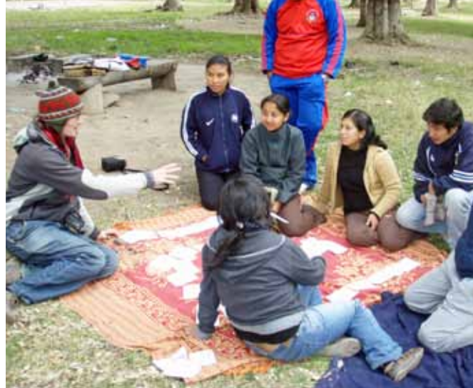
El Consejo juvenil de Oña esta reunido. Derecho: Jóvenes descubren la relación causa-efecto de sus problemas por medio de juegos.