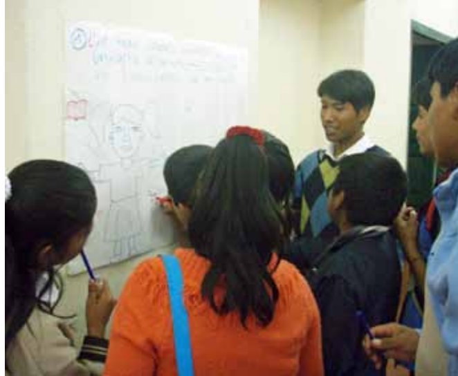
Consejo Juvenil del Canton de Oña (CJCO). Derecho: Los jóvenes de la Red Municipal señalan por medio de dibujos y textos los problemas y necesidades de las juventud de San Jerónimo.