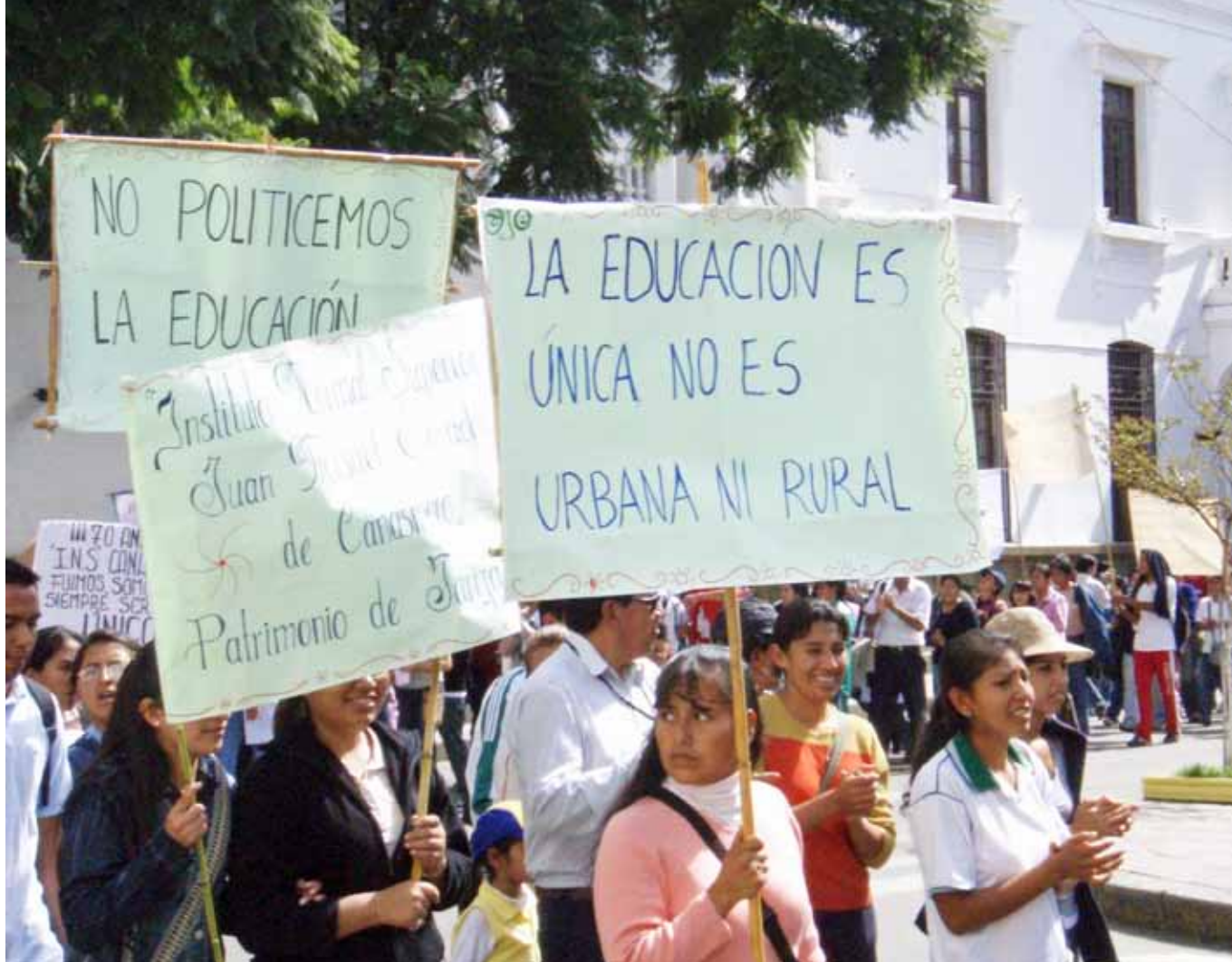
Manifestación de los estudiantes de las comunidades rurales en Tarija

jóvenes de manera activa. Las organizaciones también pueden aprender cosas una de la otra en vez de reclamar un monopolio en ciertas áreas de trabajo. La autoridad local puede asumir un papel director en este respecto. El proyecto de bibliotecas en San Jerónimo, el municipio hermano de Edegem, muestra muy bien como una cooperación entre una autoridad local y una ONG puede conducir a un buen resultado. Además se concentra en la integración de los jóvenes provenientes de las zonas rurales, partes de un municipio que son olvidadas en muchas ocasiones.