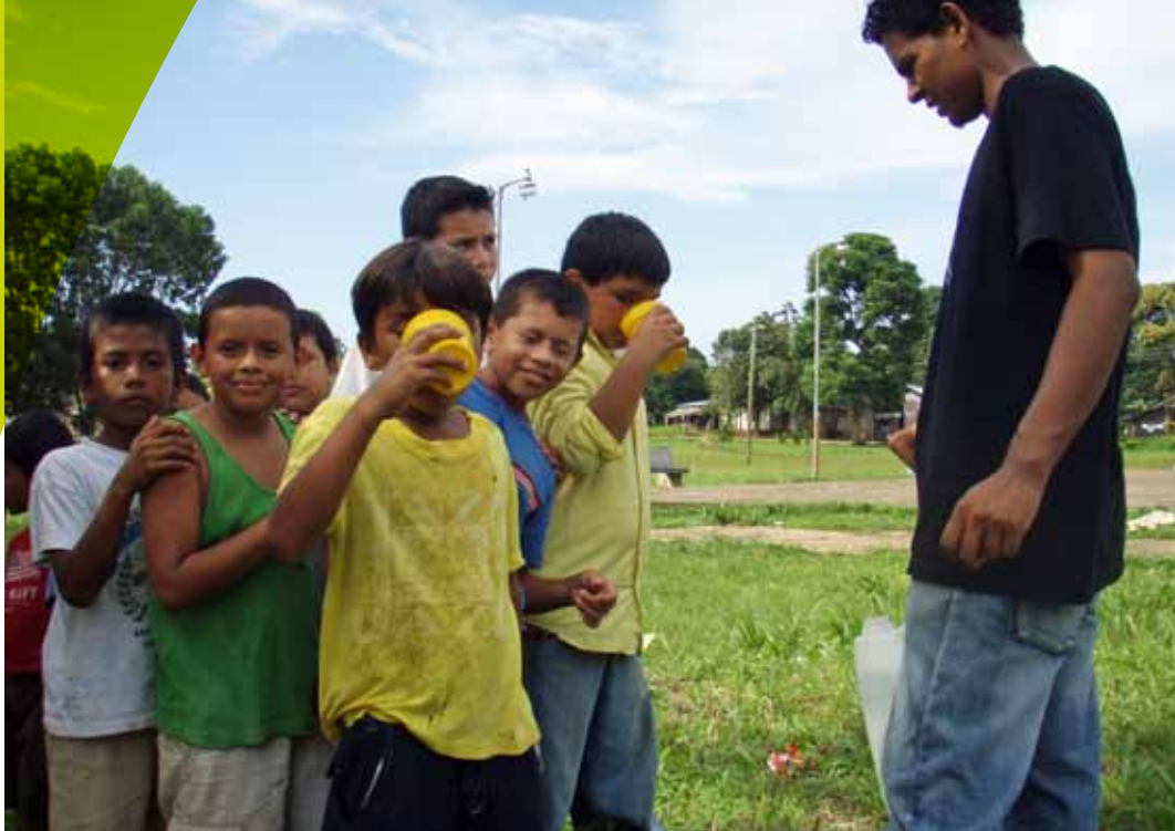
Jóvenes jugando en Nicaragua