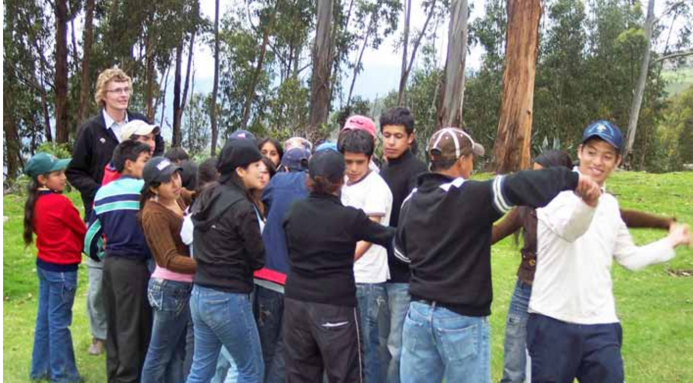
Jóvenes Ecuatoriano juegan 'dokter knoop' (médico mezclado) durante un campamento